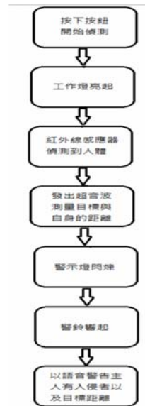
圖六、警報器動作過程