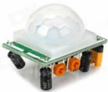
圖三、Arduino紅外線感測器