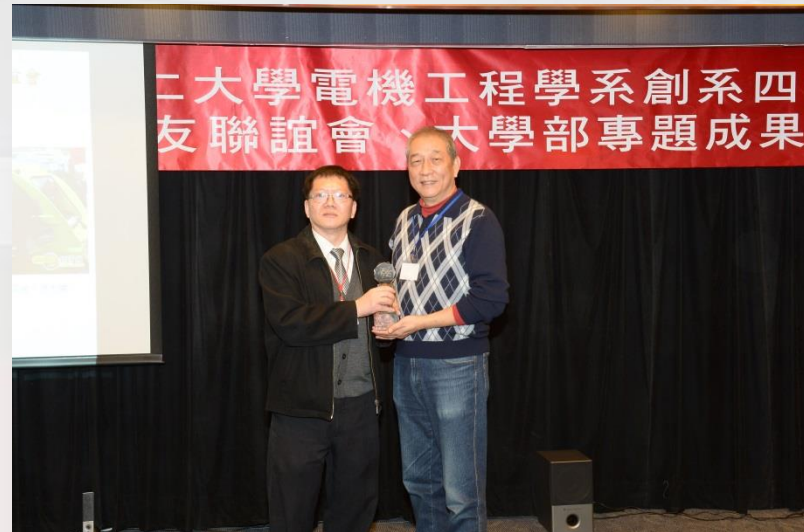
106年獲頒本系傑出系友(龍學長代領)